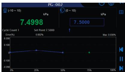
압력 게이지 / 트랜스미터 / 스위치 교정 화면