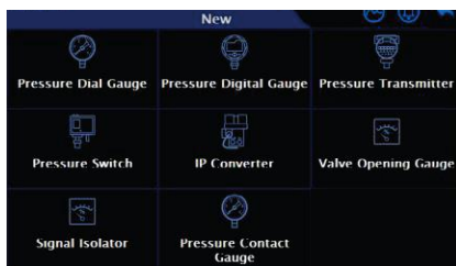
다양한 작업관리 메뉴