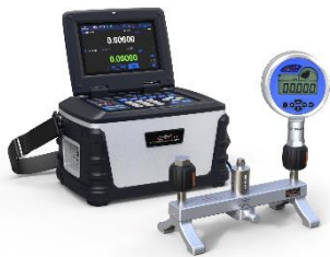
압력 게이지 교정 (디지털 및 다이얼)