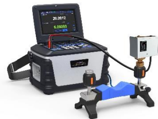
압력 스위치 교정