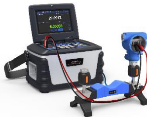
압력 트랜스미터 교정