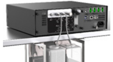
외부 유체 저장소 확장