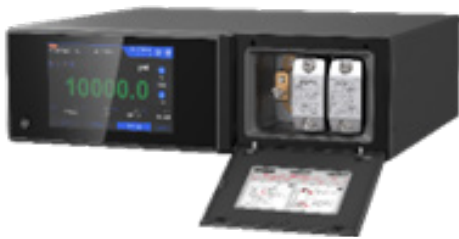
간편한 압력모듈 교체