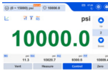
플 레인지의 20% 30초 이내 도달