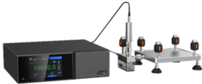
오염 방지 시스템 (옵션)