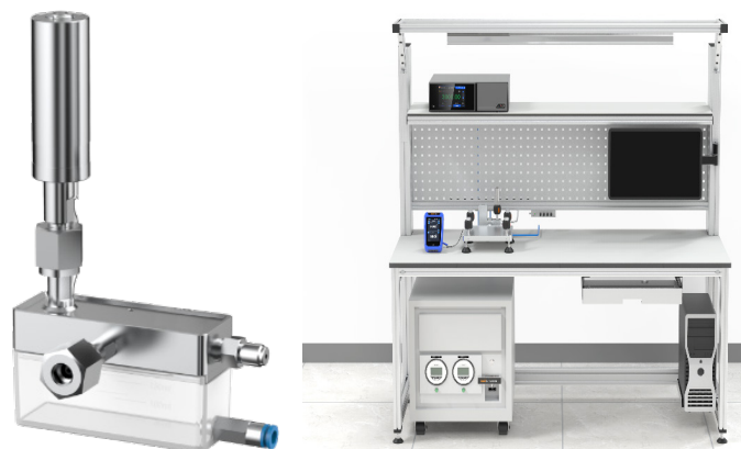
*오염 방지 시스템 (CPS)

경기도 성남시 분당구 황새울로 360번길 21, 602호 Tel. 070-7542-7836 Fax. 070-8630-7787 Email. sales@bminst.co.kr www.bminst.co.kr