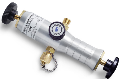
DV0V Vacuum Hand Pump