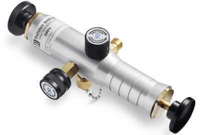
DPPV Pressure/Vacuum Hand Pump