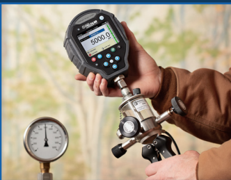
게이지 및 교정 기준장비

Ralston Instruments는 완벽한 압력 교정 솔루션을 제공하고 압력테스트, 유지보수 및 수리 작업을 신속하고 정확하게 만듭니다.