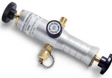
DP0V Pressure Hand Pump